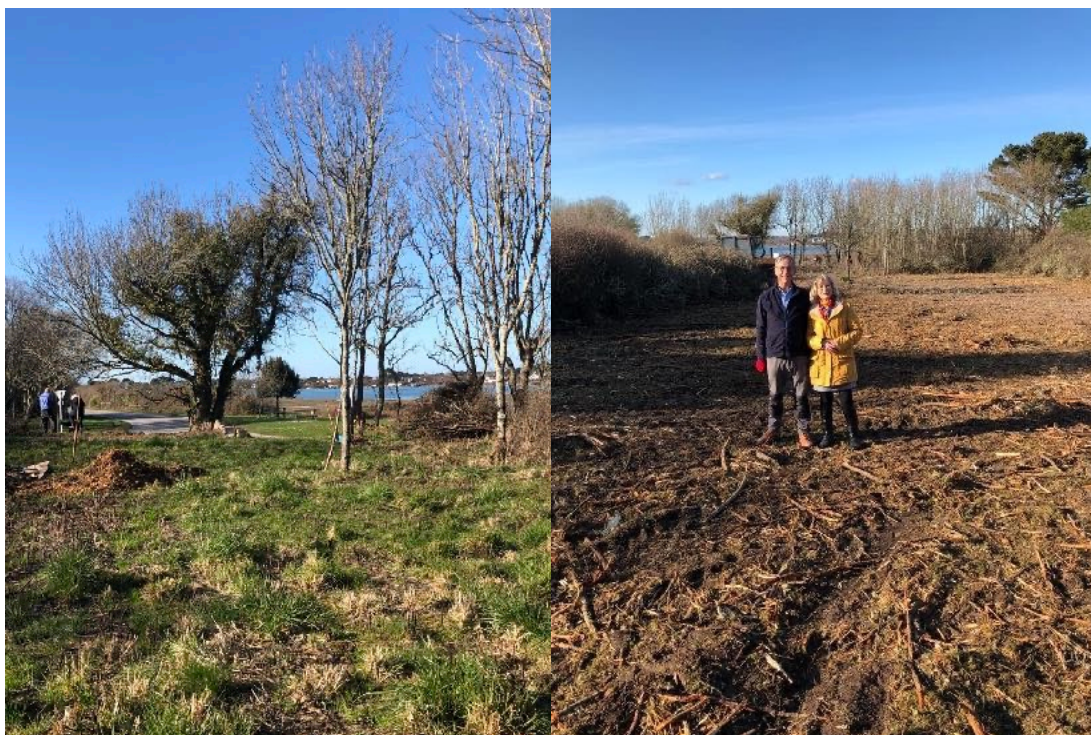
Le 26 février 2021